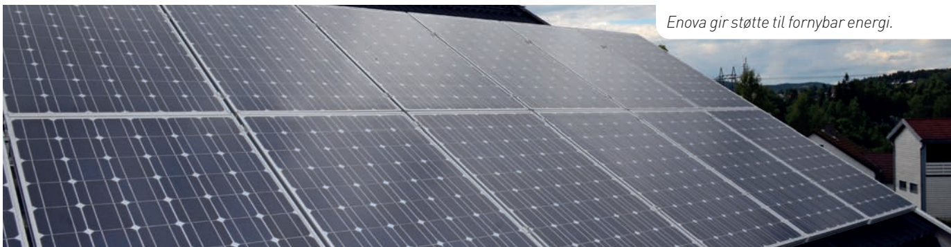
Enova gir støtte til fornybar energi.